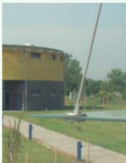
Das Gebäude „Naturwissenschaften“ des Solar-Campus Jülich